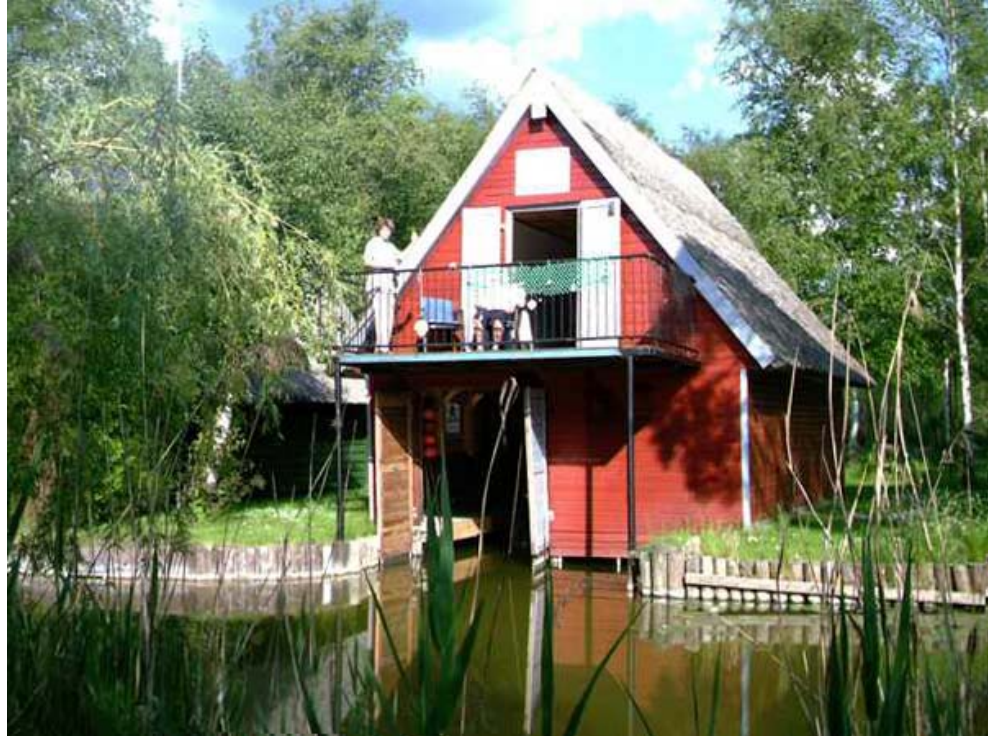
Mildenitz + Bootshaus (Stand 10.2009)