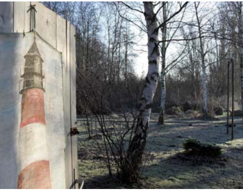
Blick in den Garten + in das direkt angrenzende Naturschutzgebiet