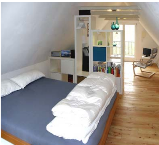
Franz. Bett (1.60m x 2.00m)