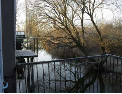
Blick vom Balkon auf die Mildenitz