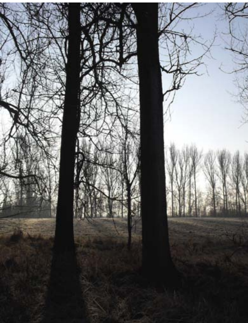
Felder angrenzend zum Bootshaus