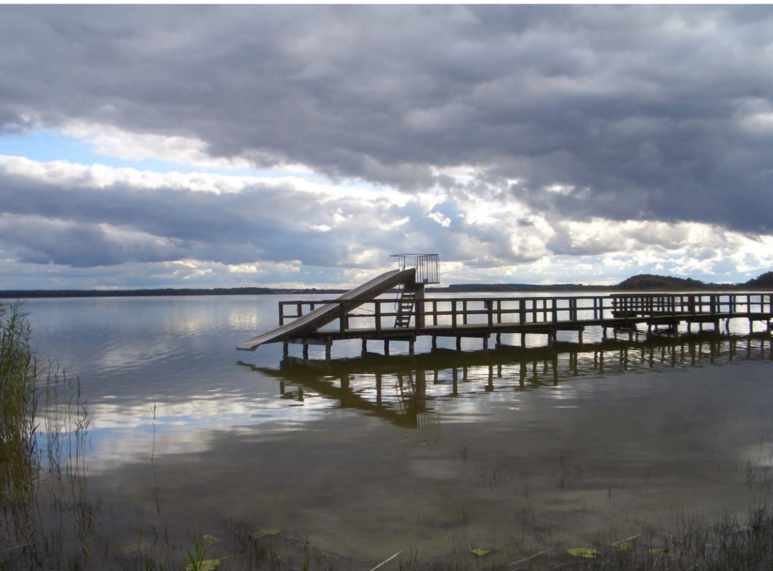
Badestelle am Goldberger See im November 2009