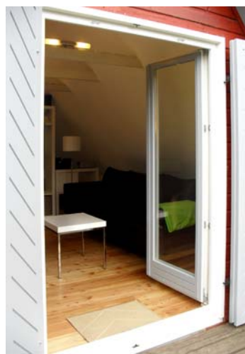
Sofa mit Schlaffunktion (1.40m x 2.00m)