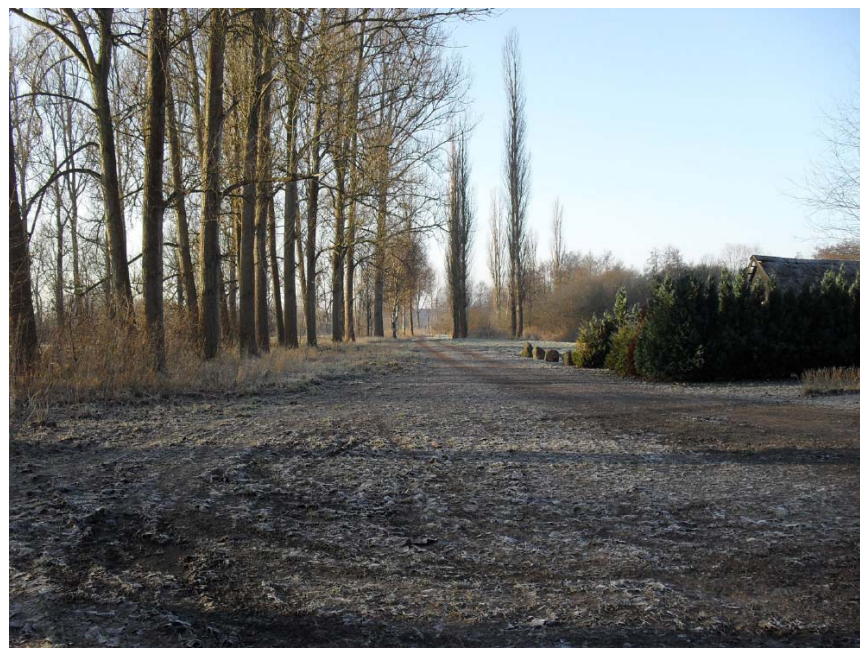
Abb. re.: „Parkplatz“ vor dem Bootshaus (Es gibt KEINE zugewiesenen Parkplätze). Das Bootshaus ist nur über einen Feldweg zu erreichen. Der Wendehammer ist bei starken Regenfällen matschig! Bitte Schuhe im Eingangsbereich wechseln.