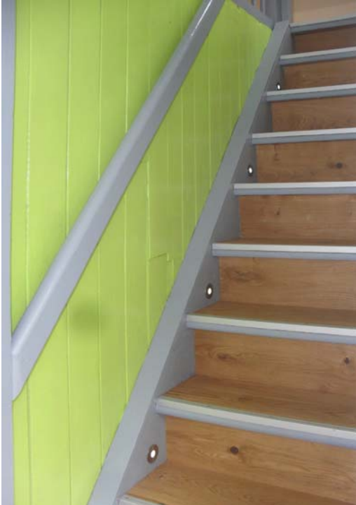
Eichentreppe mit integrierter Beleuchtung