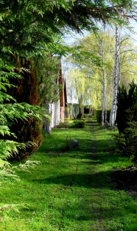
Pfad zu den Bootshäusern